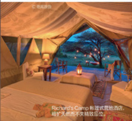
Richard's Camp 帐篷式营地酒店，粗犷天然而不失精致品位。