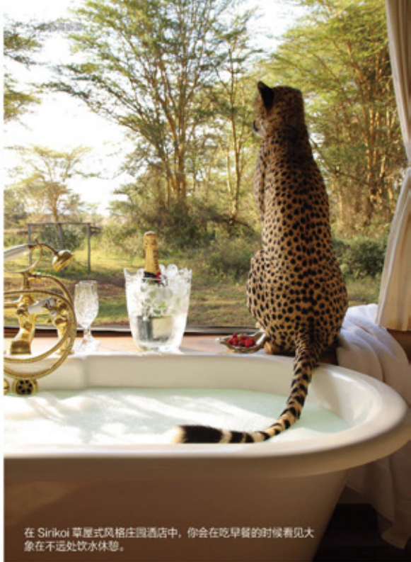
在 Sirikoi 草屋风格庄园酒店中，你会在吃早餐的时候看见大象在不远处饮水休憩。